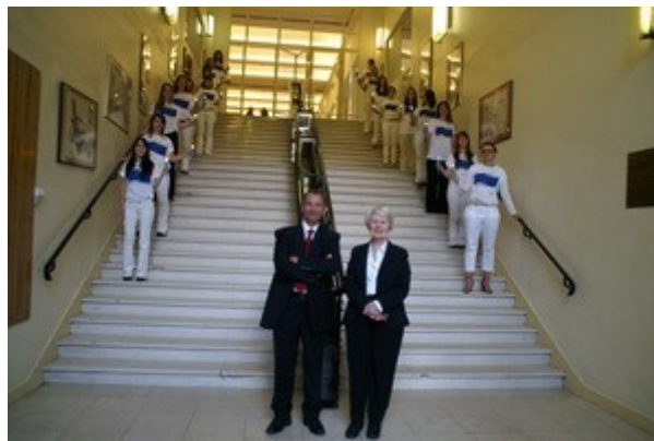
Accueil du Président et de la Vice-Présidente